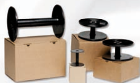
Bobine in plastica Plastic reels