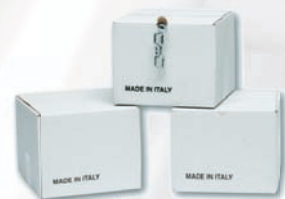
Scatole Carton Box