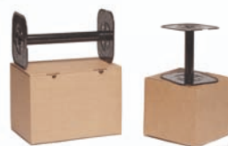
Bobine in ferro Metal reels